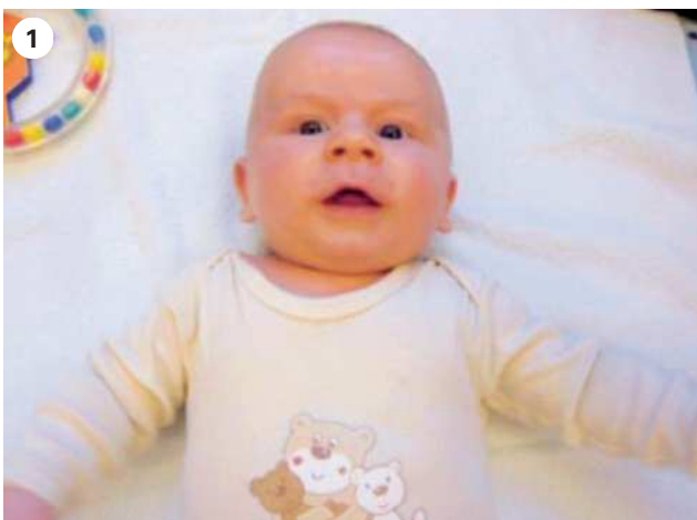
Foto 1: Knabe, 2 Monate: primäre Plagiozephalie mit Gesichtasymmetrie. Rechts occipitale Eindellung mit in der Folge rechts frontaler Vorwölbung (die verschiedenen Größen der Augen beachten!), Schiefhaltung mit muskulärer Dysbalance. | Photo 1: garçon, 2 mois: plagiocéphalie primaire avec asymétrie faciale. Déformation occipitale droite avec par suite un gonflement frontal à droite (noter la taille différente des yeux!); position penchée de la tête avec déséquilibre musculaire.

Dans les années 90, de nouvelles recommandations ont été adoptées afin d'éviter la mort subite de l'enfant ou Sudden Infant Death Syndrom (SIDS). Il est depuis devenu d'usage de coucher les bébés sur le dos. Mais de ce fait – en raison de la position privilégiée de la tête – la prévalence du torticolis est passée de 8 à 12.5%. Il est donc conseillé de