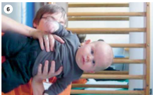
Foto 6: Muskelfunktionsmessung nach Öhmann (vgl. auch Abbildung 1) [10]. Derselbe Knabe mit 3 Monaten erreicht auf der Muskelfunktionskala auf beiden Seiten einen guten Wert von 2 nach vier physiotherapeutische Behandlungen und konsequentem Handling durch die Eltern. | Photo 6: Mesure de la fonction musculaire d'après Öhmann (cf. aussi illustration 1) [10]. A trois mois, le même garçon obtient une bonne valeur (2) pour les deux côtés sur l'échelle mesurant la fonction musculaire (au terme de 4 séances de physiothérapie et de manipulations adaptées des parents).

Der Befund und das Behandlungsergebnis werden mit einem standardisierten Assessment dokumentiert. ROM-Messungen mit dem Goniometer/Protraktor belegen den verkürzten SCM und eingeschränkte Gelenksfunktionen. Mit einem Video-Assessment [3] kann beobachtet werden, ob tatsächlich eine bevorzugte Lage vorliegt. Gleichzeitig wird auch die Qualität der Motorik beurteilt. Dazu werden die Tests «General Movements» 10 (bis 16 Wochen) und «Infant Motor Profile» 11 (3–15 Monate) eingesetzt. Die Bewertung der Haltung ist im Alter von 6 bis 16 Wochen über eine 12-Punkte-Asymmetriekala [8] möglich. Auf Fotos lässt sich der Neigungswinkel des Kopfes ausmessen [9]. Die Muskelfunktion für die Aufrichtung des Kopfes wird in gehaltener horizontaler Seitenlage auf einer Skala von 0–5 gemessen [10]. Dabei muss der Kopf mindestens 5 Sekunden gehalten werden können (siehe Abbildung 1 und Foto 6 ), was ab dem dritten Monat, nach Entwicklung der physiologischen Stellreaktionen, möglich wird. Eine Plagiozephalometrie zeigt den Verlauf der Schädelverformung auf ( Foto 7 ) [2].