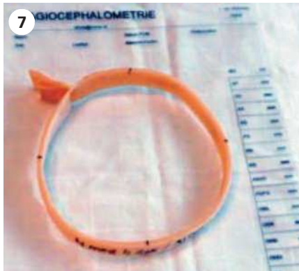
Foto 7: Mit einer Plagiocephalometrie kann der Verlauf der Schädelverformung aufgezeigt werden, was eine Entscheidung für oder gegen eine Helmredression erleichtern kann. | Photo 7: Une plagiocéphalométrie permet de voir l'évolution de la déformation crânienne, ce qui peut faciliter la décision en faveur ou en défaveur d'un redressement avec casque.

Die Kinderphysiotherapeutin behandelt muskuloskelettal sowie gemäss der neurologischen Entwicklung des Kindes [11–13]. Sie coacht die Eltern in spezifischen Übungen und Handling. Bis 2004 wurde der Behandlungseffekt bei Tortikollis über Kohortenstudien nachgewiesen. 2007 wurde in einer RCT-Studie an 65 Babys mit bevorzugter Lage der Effekt standardisierter Kinderphysiotherapie für Plagiocephalie belegt [3]. Es wurden 33 Kinder während 4 Monate behandelt, die Kontrollgruppe mit 32 Kindern erhielt die übliche Begleitung. Im Alter von 6 und 12 Monate (Follow Up) zeigen die Eltern der Interventionsgruppe ein deutlich symmetrisches Handling, die Kinder weniger Asymmetrie in Haltung und Bewegung sowie weniger Plagiocephalie (26% bei 6 Mte, 32% bei 12 Mte).